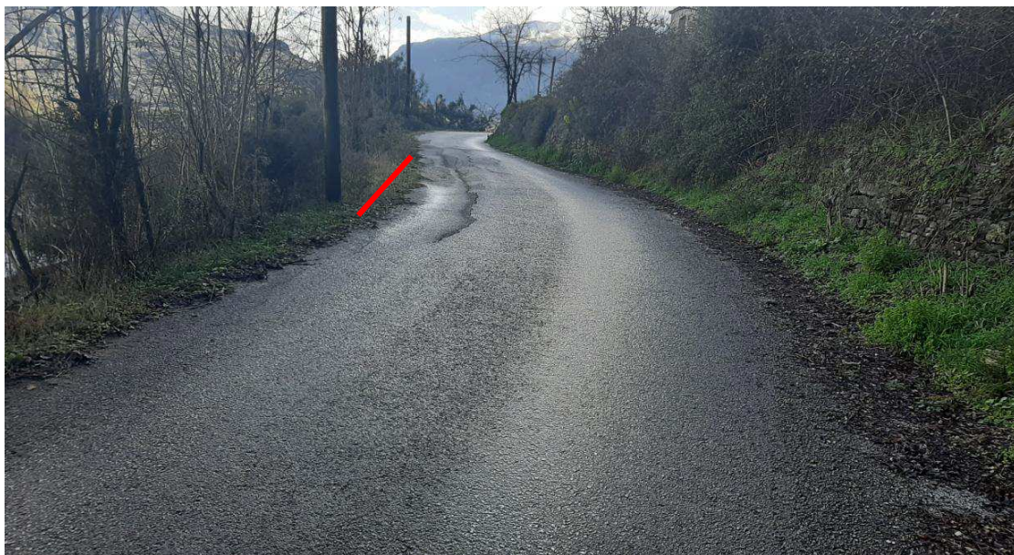
——— ΘΕΣΗ ΤΟΙΧΙΟΥ