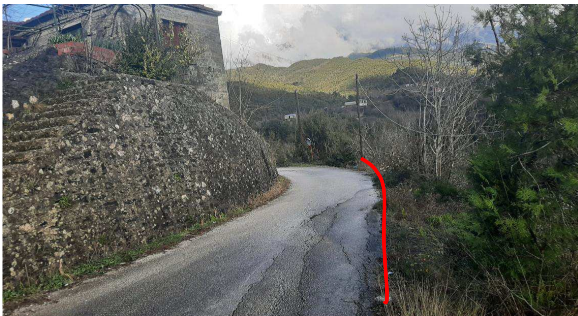
——— ΘΕΣΗ ΤΟΙΧΙΟΥ